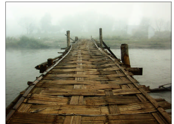
Das Foto „Brücke ins Nirgendwo“ von Uwe Erler (Jena) gehörte zur 5. Landesfotoschau Thüringens. Der Autor gewann den Hauptpreis des Wettbewerbs.