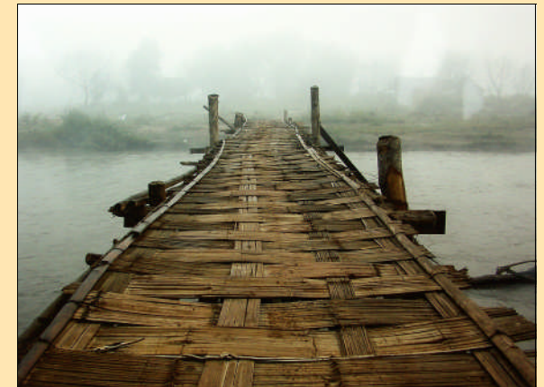
Das Foto „Brücke ins Nirgendwo“ von Uwe Erler (Jena) gehörte zur 5. Landesfotoschau Thüringens. Der Autor gewann den Hauptpreis des Wettbewerbs.