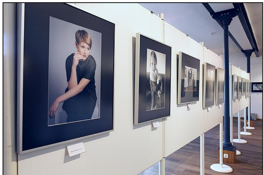
"Geisterausstellung" im Stadtmuseum Saalfeld