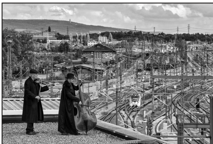
Das Foto "Netzwerk" von Dr. Aribert Janus Spiegler (Erfurt) gehörte - wie auch obiges Bild - zur 11. Landesfotoschau. Das Bild wird auch in der aktuellen Ausstellung von Dr. Spiegler (siehe S.2) gezeigt.

Die Eröffnung der Ausstellung wird am 14. März 2020 um 11 Uhr im Stadtmuseum Saalfeld sein. Danach wird die Ausstellung unter anderem in Erfurt, Jena, Gera, Gotha und Sondershausen gezeigt. Weitere Stationen werden sicher noch dazu kommen.