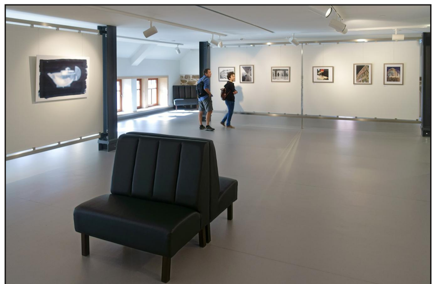
Teil der Ausstellung im KunstForum

Zur Ausstellung ist ein Katalog mit allen Fotos erschienen.