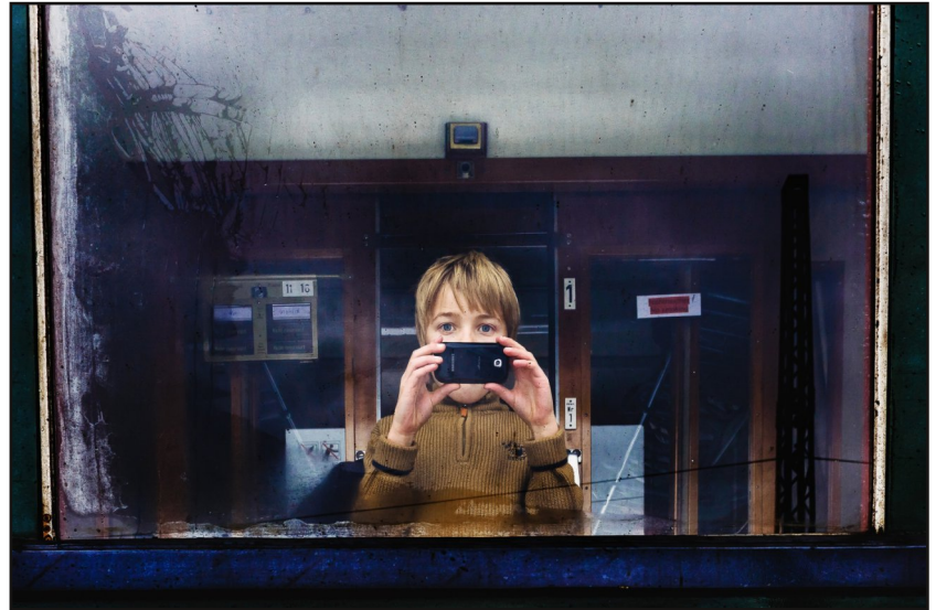
Das Foto „Zeitreise“ von Jens Gutberlet (Benshausen), mit dem er den dritten Preis der 9. Landesfotoschau gewonnen hatte, ist das Gesicht für die Werbung zur 10. Landesfotoschau.

Abschlussveranstaltung am 19. März in Berlin-Marzahn