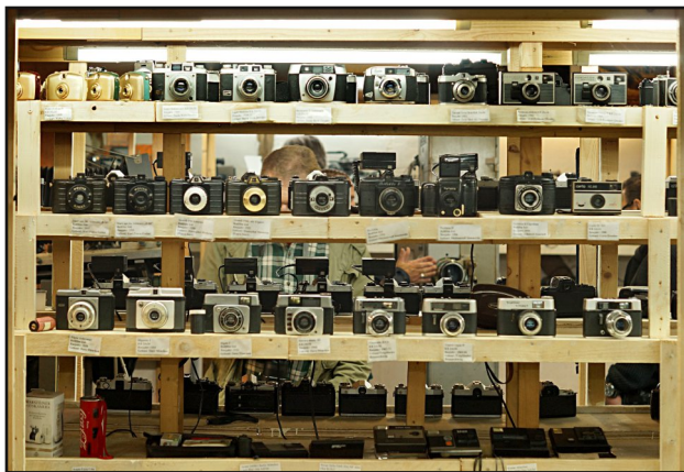
Das Foto zeigt eines der vielen Regale im Kameramuseum Reurieth. Ein Besuch lohnt sich. (Dorfstr. 62, 98646 Reurieth)

Herzlichen Dank an den Fotoclub Themar für den sehr schönen Tag!