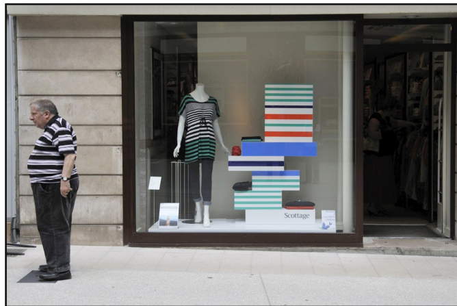
Eines der drei Preisträgerbilder stammt von Ulrich Seehagen und trägt den Titel „Die neue Ware“.

Inzwischen sind die Fotos auch in einer Galerie auf unserer Webseite zu sehen.